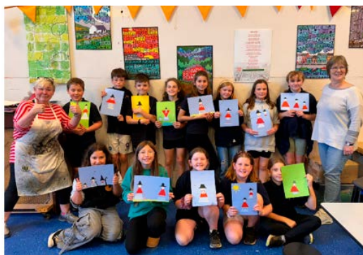
Plant blwyddyn 5 yn Oriol MoMA, Machynlleth