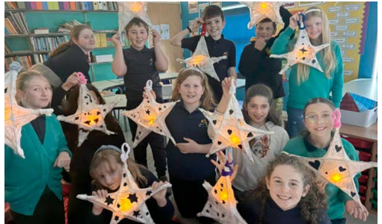
Plant Bl 6 a'u llusernau