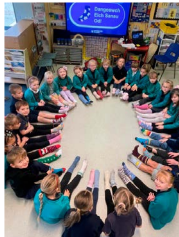
Diwrnod Sanau Od ym Mlwyddyn 1