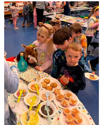
Prynu a gwerthu yn ystod diwrnod Plant Mewn Angen