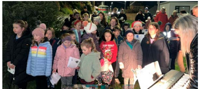
Goleuo Coeden Nadolig y pentref.