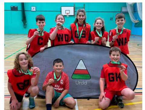
Aelodau tîm pêl rwyd cymysg yr ysgol.