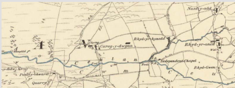
Map Arolwg Ordnans 6" IV NW (1887)