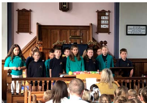
Blwyddyn 6 yn cyflwyno neges Diolchgarwch